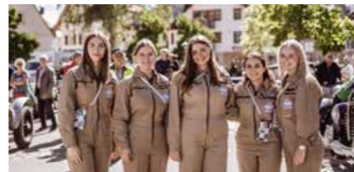
Das ganze Team der Baiersbronn Touristik freut sich, mit Ihnen die 11. Ausgabe der Baiersbronn Classic zu feiern.